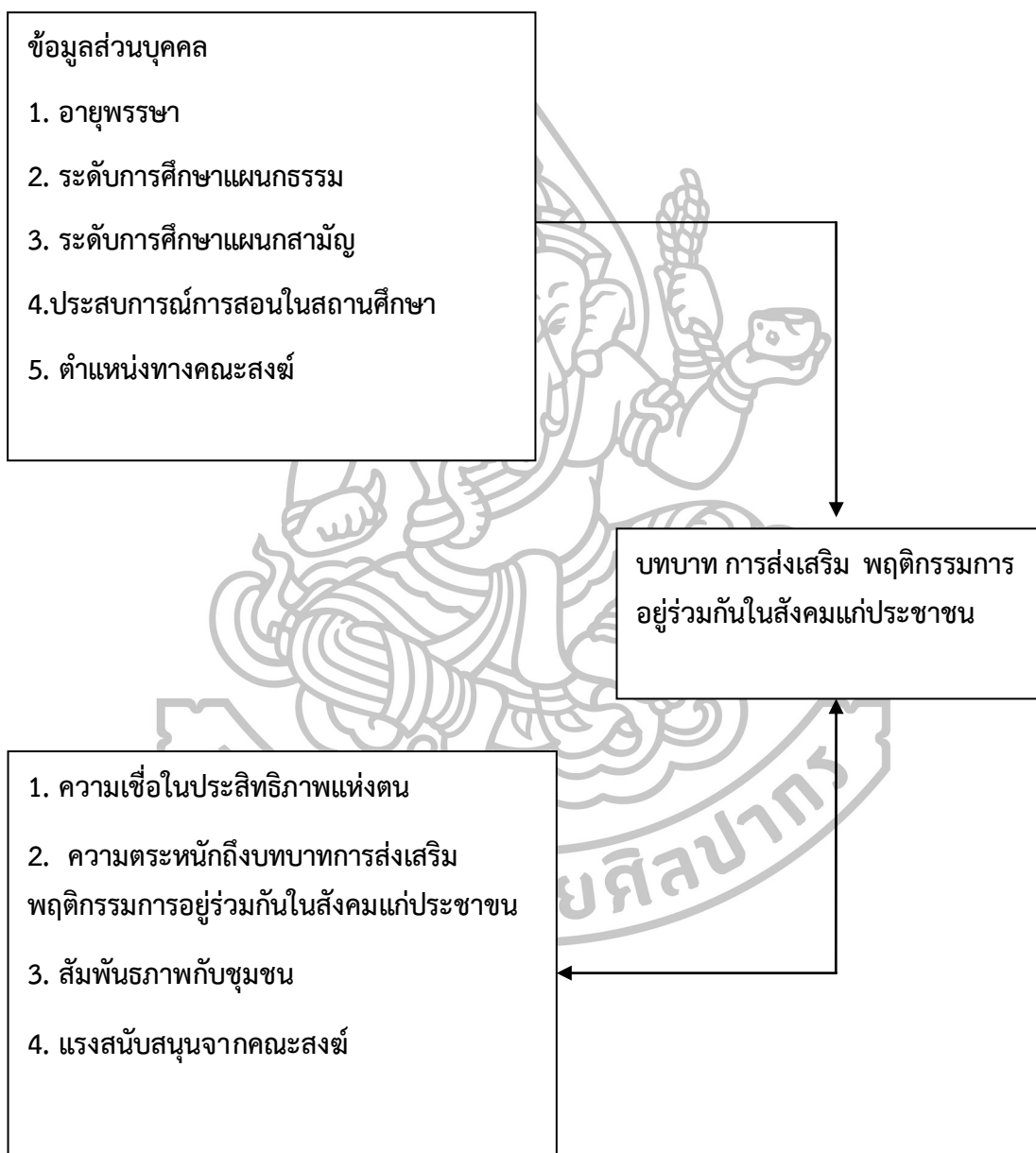
แผนภูมิที่ 4 แสดงกรอบแนวคิดในการวิจัย