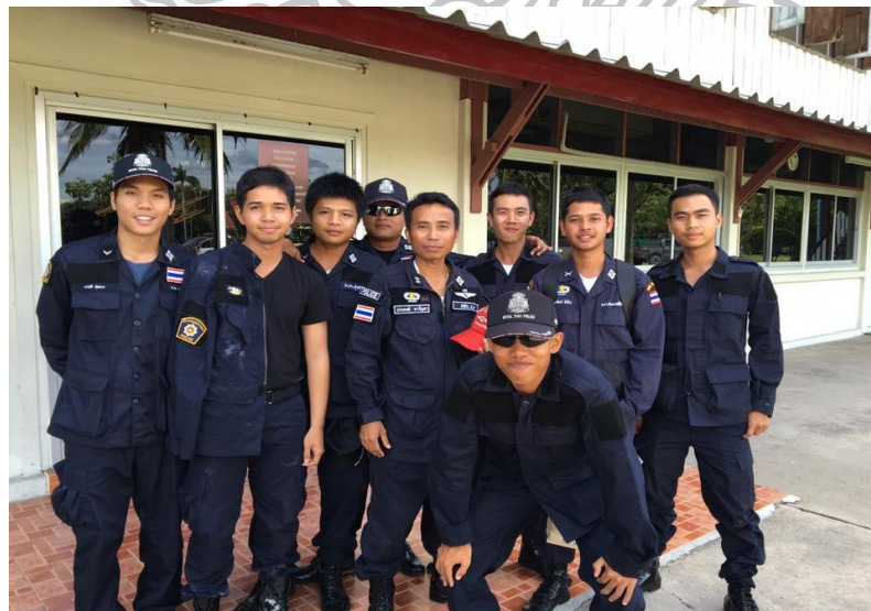
ภาพที่ 6 การเตรียมตัวก่อนเข้าฝึกกับหน่วยรบพิเศษพลร่ม ค่ายนเศวร โดย เป็นอีกรูปแบบหนึ่งของการให้รางวัลแก่ตนเองของเจ้าหน้าที่ตำรวจ