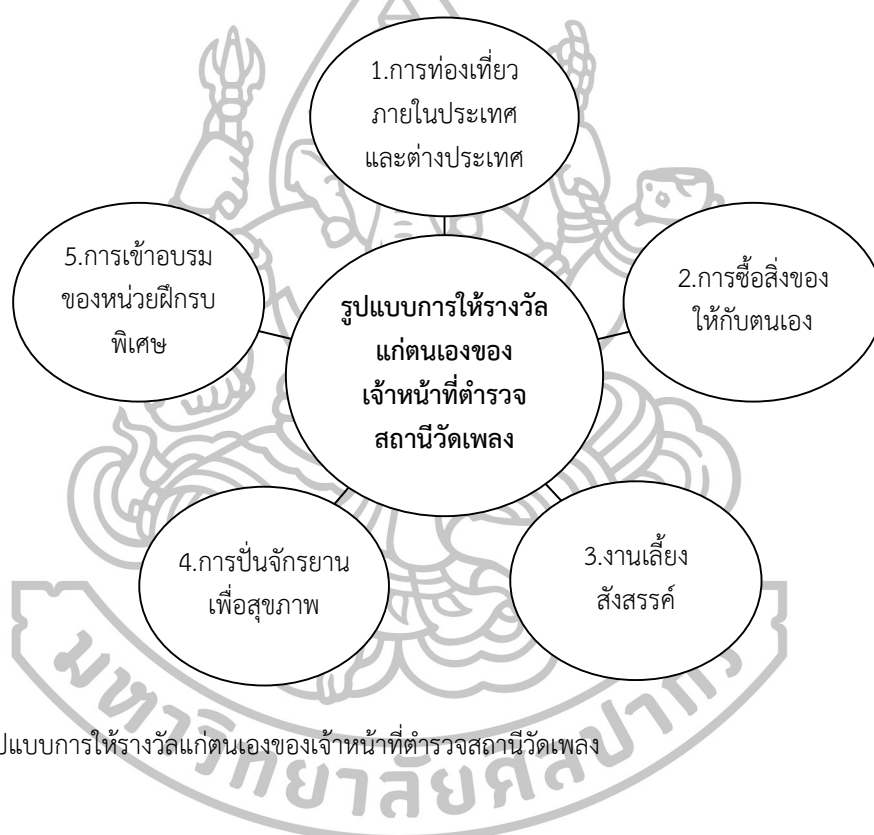
แผนภาพที่ 2 รูปแบบการให้รางวัลแก่ตนเองของเจ้าหน้าที่ตำรวจสถานีวัดเพลง

จากผลการศึกษา รูปแบบการให้รางวัลแก่ตนเองของเจ้าหน้าที่ตำรวจ สามารถสรุปได้ ตามแผนภาพที่ 2 ดังนี้