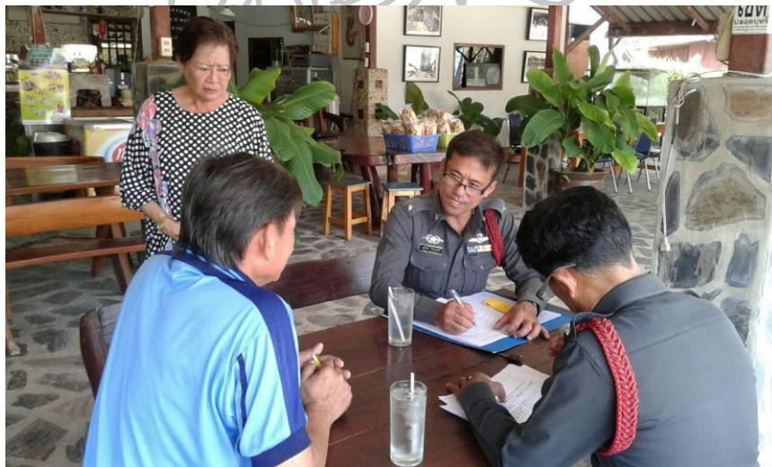
ภาพที่ 4 การออกพบปะประชาชนและการหาข่าว รวมถึงสอบถามปัญหาที่เกิดขึ้นในพื้นที่