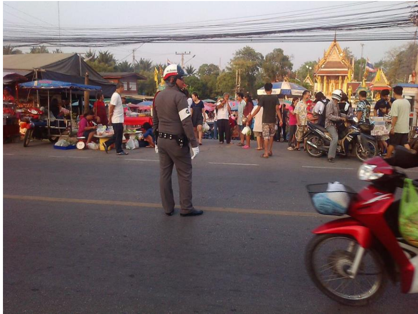
ภาพที่ 3 การดูแลความเรียบร้อยในเขตพื้นที่ทางด้าน การจราจร