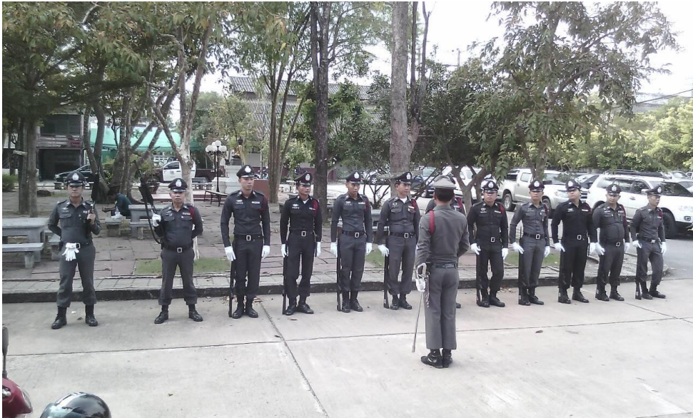
ภาพที่ 1 การเตรียมตัวก่อนออกปฏิบัติหน้าที่