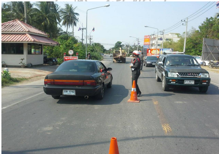
ภาพที่ 2 การออกปฏิบัติหน้าที่ และบริการประชาชน