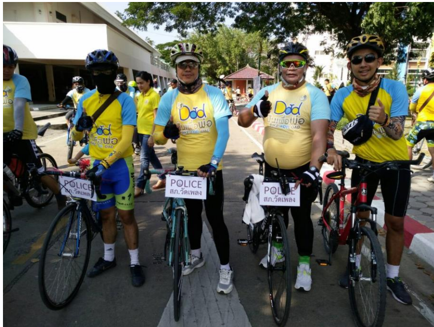
ภาพที่ 5 การปั่นจักรยานเพื่อสุขภาพ โดยเป็นอีกรูปแบบหนึ่งของการให้รางวัลแก่ตนเองของเจ้าหน้าที่ตำรวจ