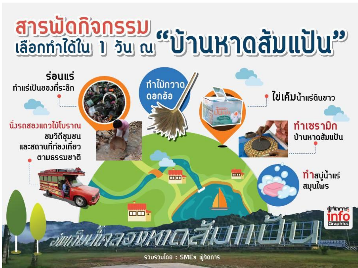
ภาพที่ 6 กิจกรรมของการท่องเที่ยวโดยชุมชนบ้านหาดส้มแป้น