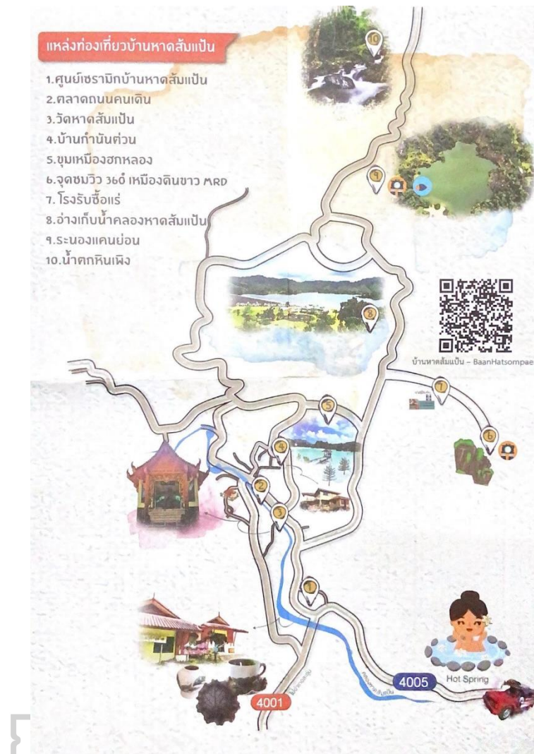
ภาพที่ 4 แหล่งท่องเที่ยวบ้านหัดสั้มแป้น