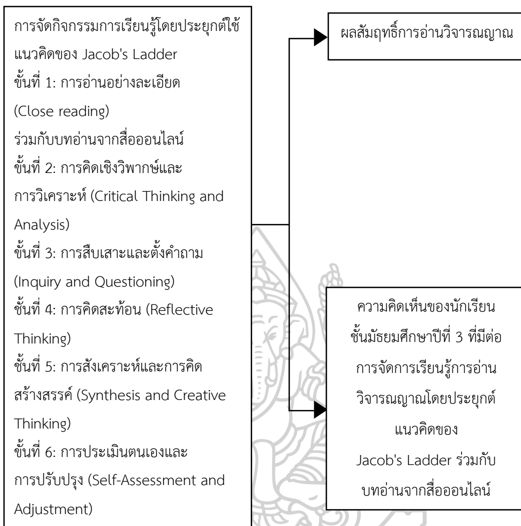
ภาพที่ 1 กรอบแนวคิดในการวิจัย