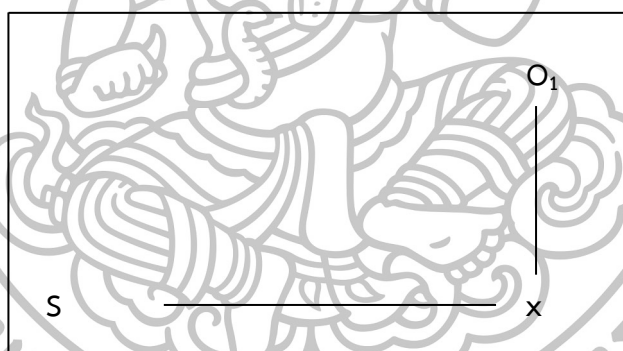
แผนภูมิที่ 3 แผนแบบการวิจัย

การวิจัยครั้งนี้เป็นวิธีวิจัยอนาคต โดยใช้เทคนิคการวิจัยแบบ EDFR ที่มีการศึกษา กลุ่มตัวอย่างเดียว โดยศึกษาจากเอกสาร วรรณกรรมและทฤษฎีที่เกี่ยวข้อง การสัมภาษณ์ผู้เชี่ยวชาญ ศึกษาสภาพการณ์โดยไม่มีการทดลอง (The One – Shot, Non – Experimental Case Study) สามารถเขียนเป็นแผนผังได้ดังนี้